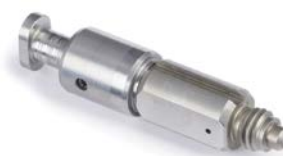
Round Mix Chamber